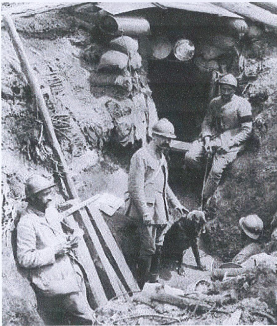
Coupe d'une tranchée

👁 Une tranchée : photographie et schéma.